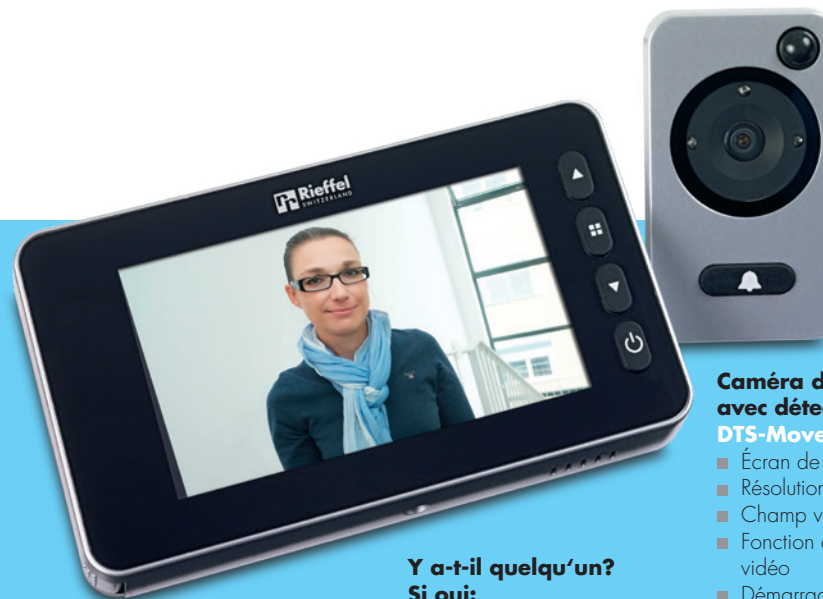
Y a-t-il quelqu'un? Si oui: «Silence, on tourne!»