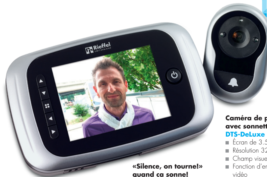
«Silence, on tourne!» quand ça sonne!