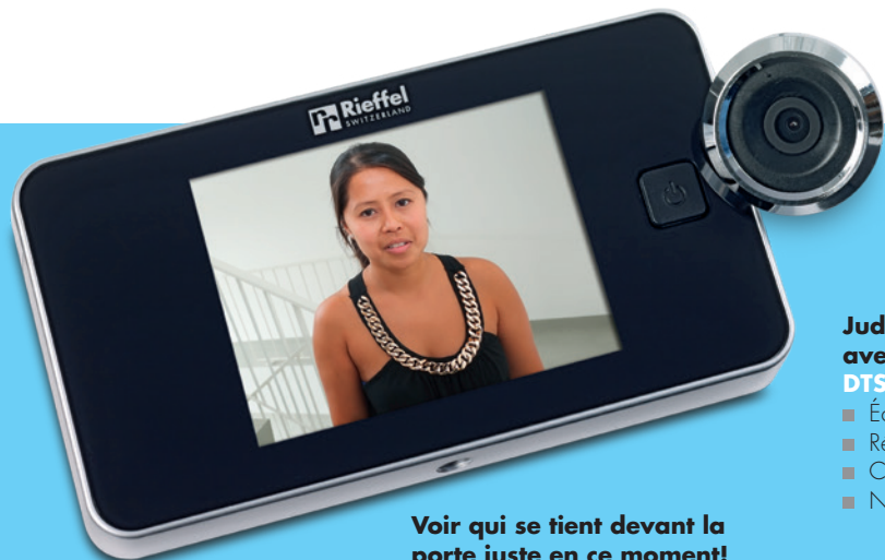
Voir qui se tient devant la porte juste en ce moment!