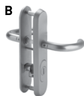
Fermeture de protection ES3