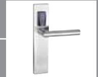
Ferrure de sécurité E