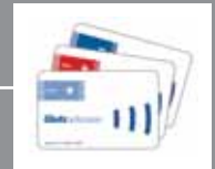
Kit de programmation de cartes